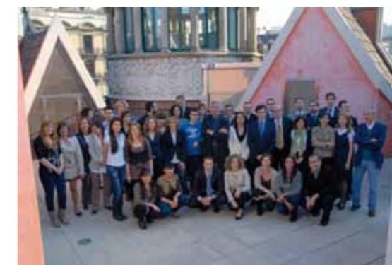
Foto de familia de los empleados del Grupo Gispert.